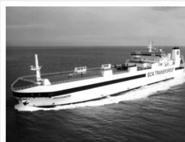
Port & Ship